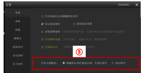
图 4 KK 录像机设置