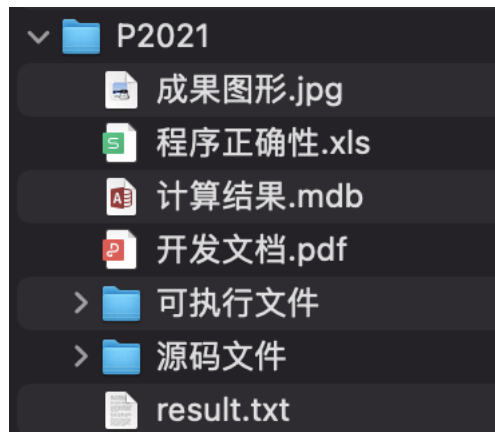
图 2 成果文件组织标准